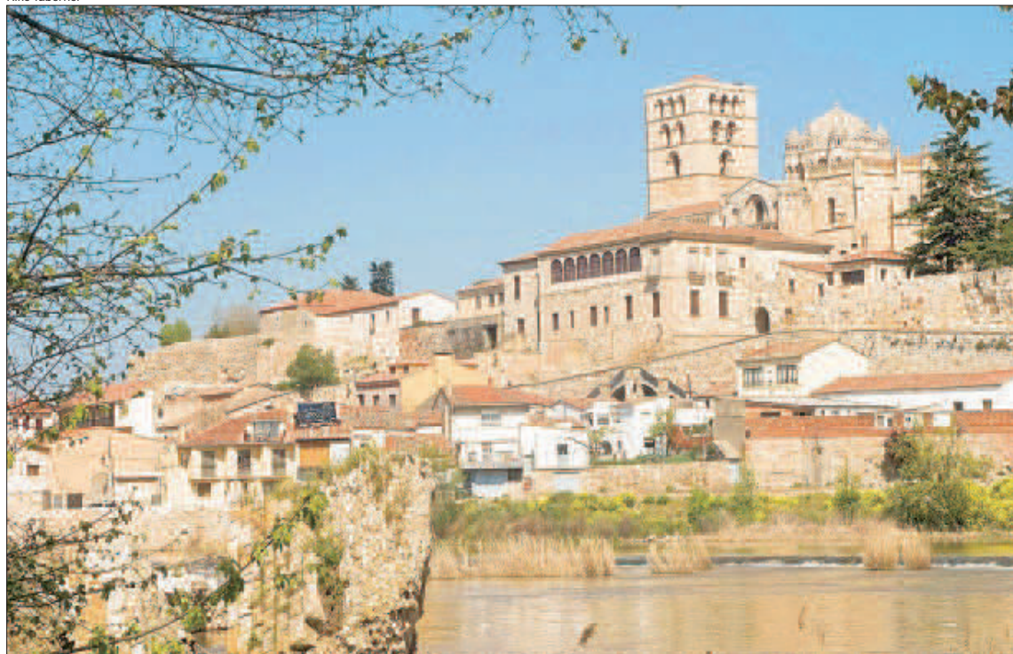
Vista de la Catedral de Zamora con el río Duero en primer término