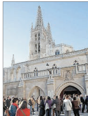
Las catedrales de León y Burgos, las más visitadas de la Comunidad

exacta del espacio que se analiza, aporta a quien lo ve una sensación de encontrarse, in situ, en el monumento, y la interacción en tiempo real con el guía convierte la visita en algo singular para los presentes, más allá del simple acceso a una web que informa escuetamente del monumento.