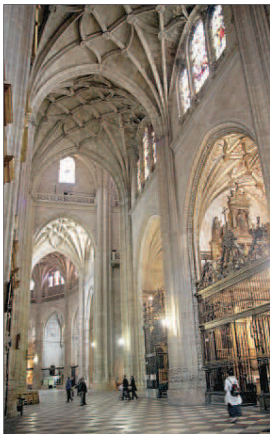
Interior del primer templo segoviano