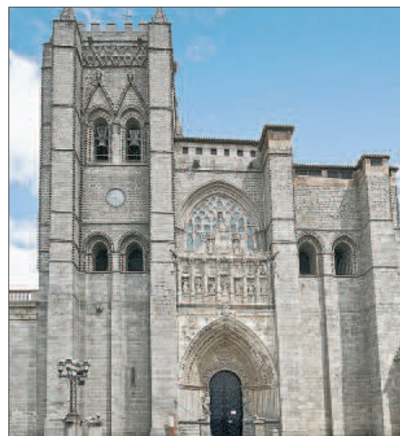
Fachada principal y acceso a la Catedral de Ávila, la primera gótica de España

bién el reservado a preguntas que desee formular el alumnado "viajero". Serán los centros quienes soliciten participar en esta iniciativa, para la que se han programado 200 visitas gratuitas, que serán atendidas por riguroso orden de inscripción. Una vez agotado ese cupo de excursiones sin coste, o en el caso de que algún colegio deseara repetir una de estas estancias cibernéticas, el desembolso para cada ocasión ascenderá a noventa euros. A ello se suma que en la web habrá, a disposición de los escolares, fichas didácticas de cada uno de los once templos seleccionados, que se podrán descargar en forma-