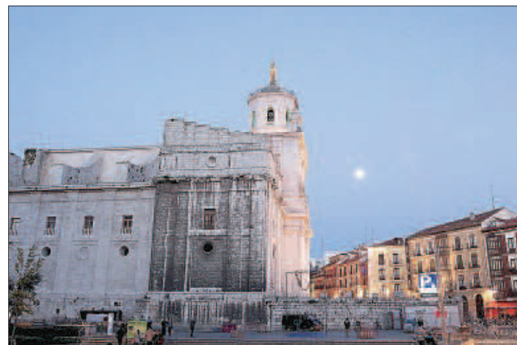
La catedral inacabada de Valladolid, en penumbra