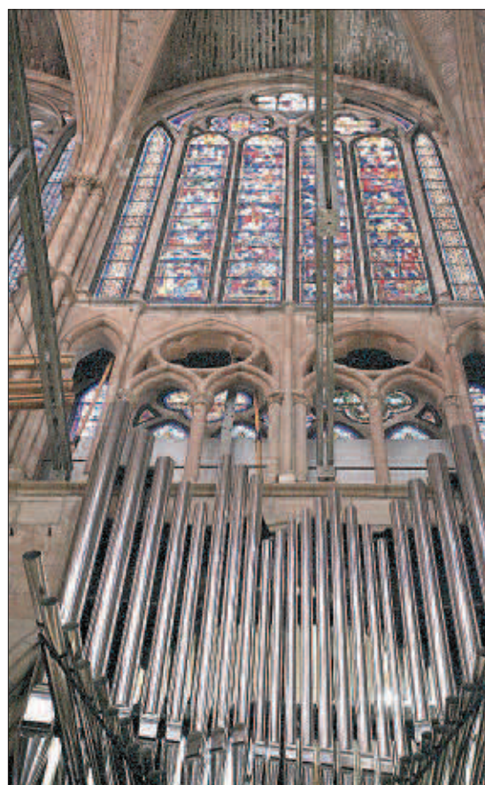
El órgano y las vidrieras de León, otro reclamo