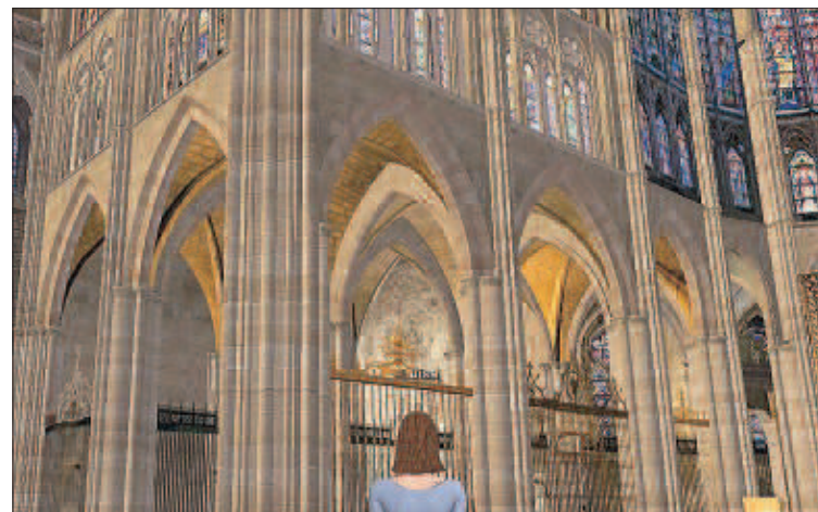
Visita a la catedral de León con la aplicación informática creada